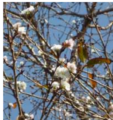
最近の暑さの影響だろうか、本山町山崎の国道 439 号で道路脇の桜が狂い咲きしていた。