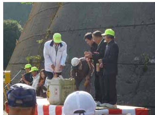
開会式の最後に地元の地酒・桂月の樽酒で鏡開きが行われ、参加者に飲んで下さいとのアナウンスがあった。