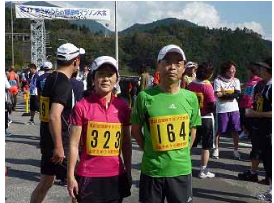
左岸側のダムサイトのゴール地点