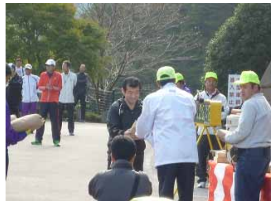
10回連続出場者は12名、15回連続出場者は4名、27回連続出場者は3名。これらの連続出場者には、大会長より表彰状と土佐町の新米5kgが記念品として贈呈された。