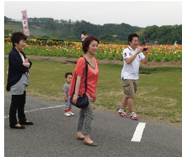
東京ドイツ村で、お花観賞～