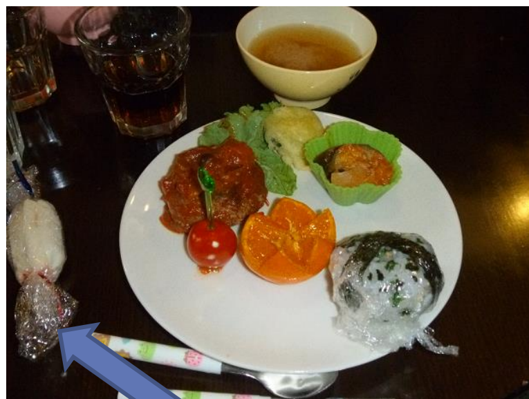
5月20日 イチゴジャムのロールサンド作ったよ～