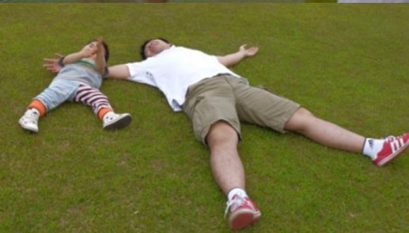
ドイツ村の遊具で沢山、遊んだよ～