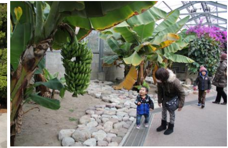
バナナの木を見て大はしゃぎ