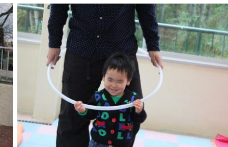
パパとフラフープ