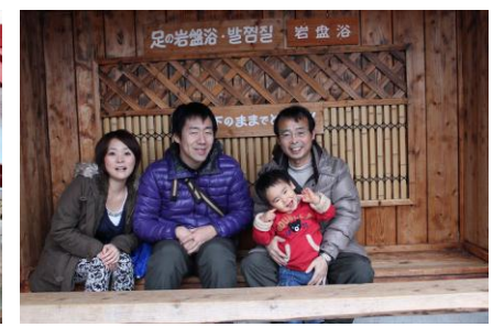
かまど地獄で足の岩盤浴～