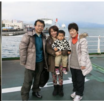
別府港をバックに船から