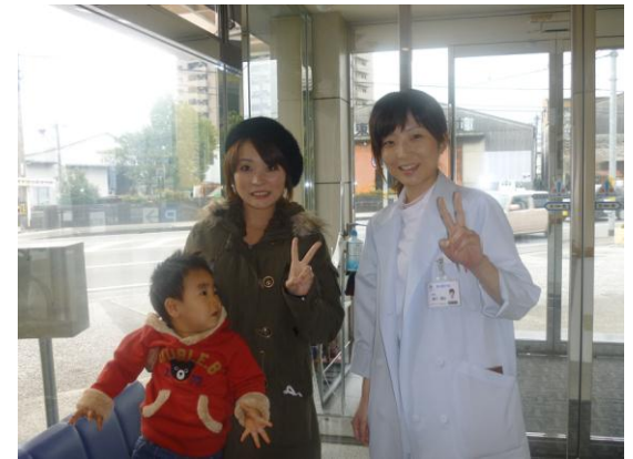
12/21 ママの幼馴染み 白衣の天使 理沙ちゃん