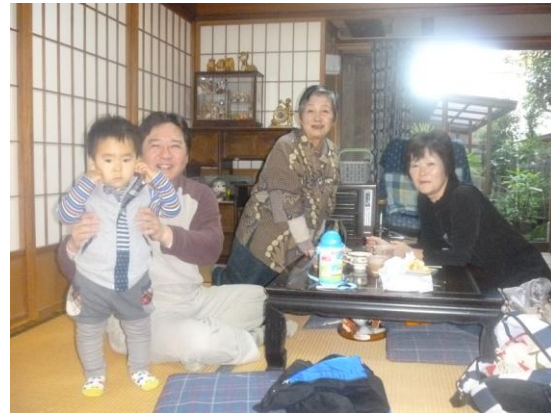
12/20 親戚(高知のひばあちゃんの妹)の家に