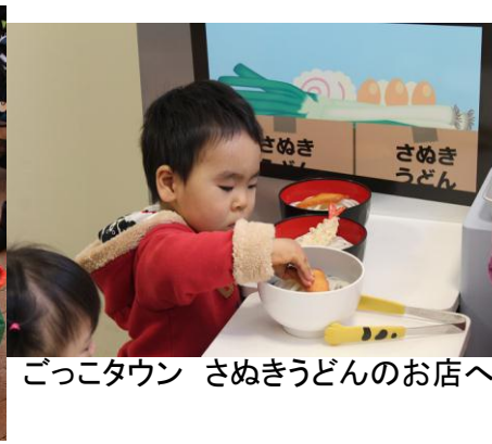
ごっこタウン さめきうどんのお店へ