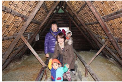
明礬温泉にある「湯ノ花小屋」