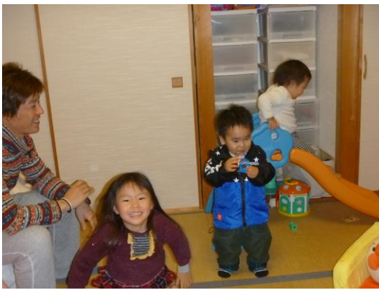
12/16 ひなちゃん、さにいちゃんの家で