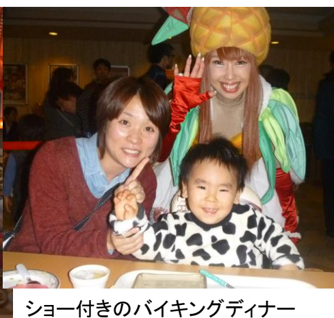
ショー付きのバイキングディナー