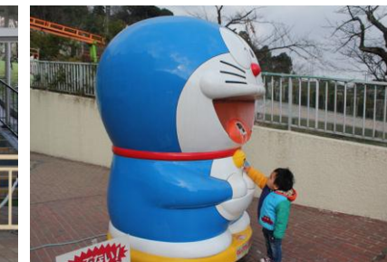
大好きなドラちゃん