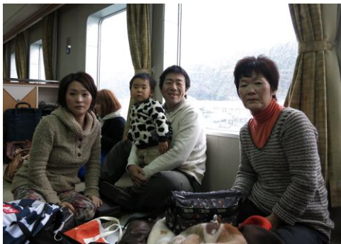
八幡浜→別府 フェリーの中